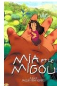
Mia et le Migou