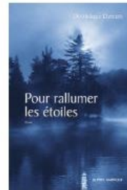
Pour rallumer les étoiles de Dominique Demers