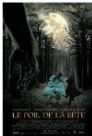
Le poil de la bête