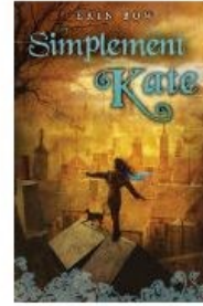
Simplement Kate d'Erin Bow