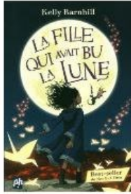
La fille qui avait bu la lune de Kelly Barnhill