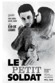
Le petit soldat