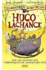
Hugo Lachance de Paul Stewart et Chris Riddell